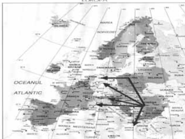
RUTE MIGRAȚIE – CETĂȚENI ROMĂNI MIGRATION ROUTES - ROMANIAN CITIZENS